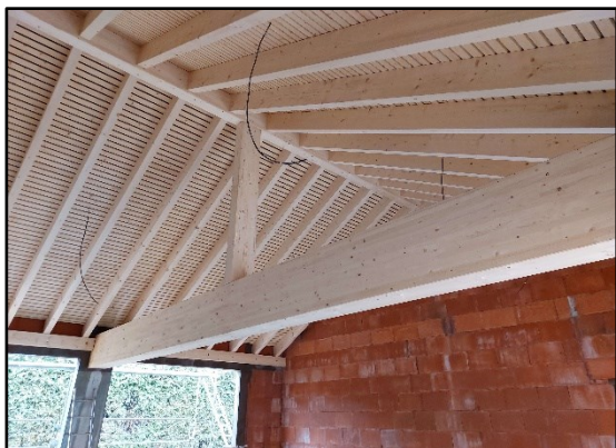
Img 1 : Toiture de l'extension (vue de l'intérieur)

Monsieur le Maire présente à l'Assemblée plusieurs photographies montrant l'avancée du chantier de construction, notamment la toiture de l'extension (Img 1 & Img 2) et les cloisons des sanitaires.