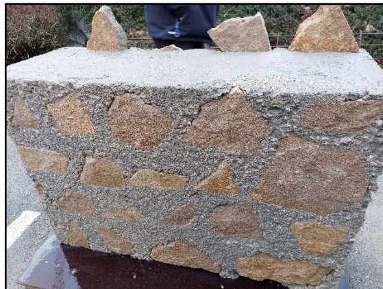
Img 3 : murs extérieurs en pierre d'Héricourt et en béton