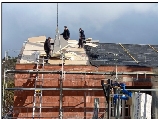
Img 2 : Toiture de l'extension (vue de l'extérieur)

La prochaine réunion avec l'architecte est prévue le 26 Mars prochain à 13h30.